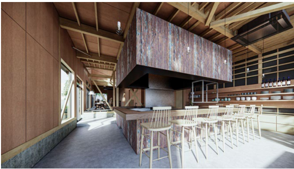
飲食スペース Neo 中華「kurage くらげ」