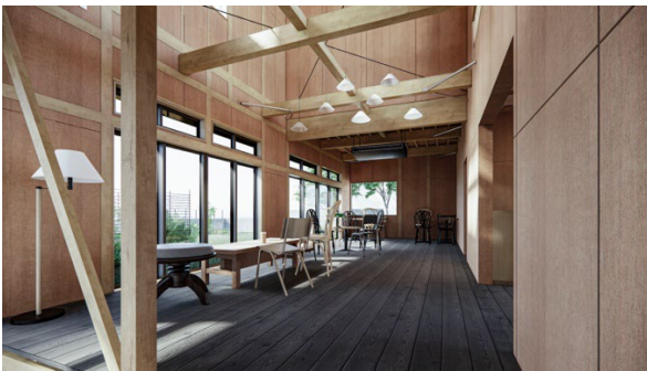
飲食カフェスペース